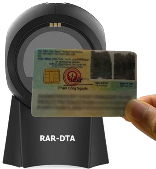
Hình 2. Đưa thẻ CCCD lại gần theo hướng chính diện thiết bị