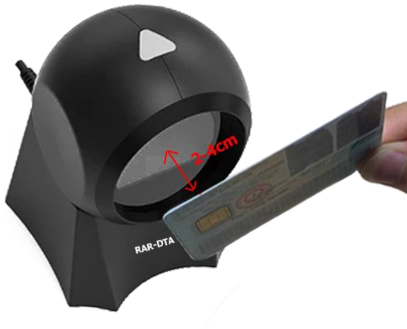
Hình 3. Khoảng cách từ thẻ CCCD đến mặt thiết bị từ 2-4cm sẽ đạt hiệu quả tốt nhất Đọc QR code thành công thiết bị sẽ phát tiếng kêu “tít” báo hiệu.