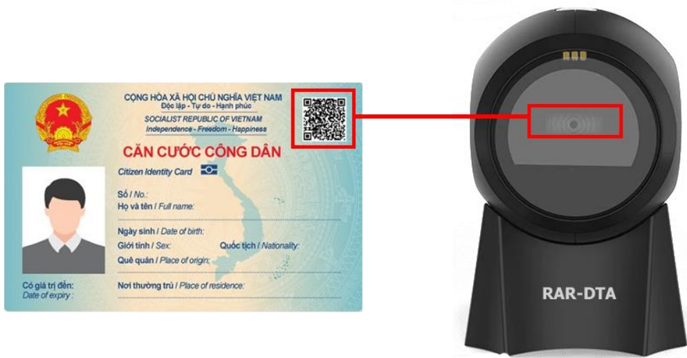
Hình 1. Đưa phần QR code trên thẻ CCCD vào vùng quét của thiết bị